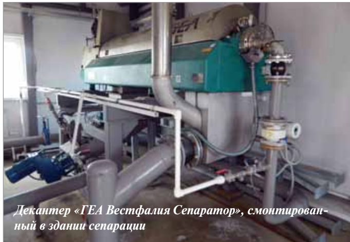
Декантер «ГЕА Вестфалия Сепаратор», смонтированный в здании сепарации

Все элементы декантера, соприкасающиеся с продуктом, сделаны из высокопрочной легированной нержавеющей стали. Выгрузные окна, защитные втулки изготовлены из твердосплавных материалов, и при необходимости их можно заменить на месте. Основные элементы, наиболее подверженные трению, защищены напылением карбида вольфрама. Ротор декантера выполнен из дуплексной нержавеющей стали методом центробежного литья, выгрузной шнековый транспортер — из высокопрочной стали. Корпус нержавеющей, лоток транспортера выстлан сменным полимерным ложем для увеличения срока службы.